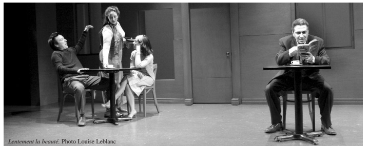
Lentement la beauté.

Ainsi, les coups de coeur du public FAIT profitent à tous les abonnés de théâtre! Nous ne sommes pas peu fiers de ramener ces deux chefs-d'œuvre dans la grande salle du théâtre.