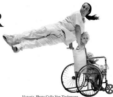
Victoria.